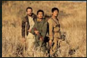
11 평창군 미담면 올치리 세트장_웰컴 투 동막골(05) 알펜시아리조트_국가대표(09)