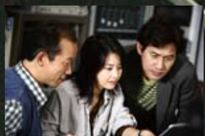
17 별마로천문대 가문의 영광(02) 라디오스타(06)