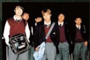
15 개운동 두사부일체(01) 편지레이디(07)