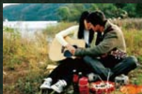
8 남이섬 겨울 나그네(86) 말죽거리 잔혹사(04)