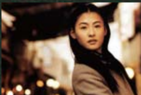
2 고성군 화진포_파이란(01)