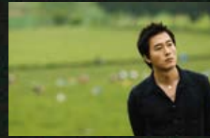
12 치악산국립공원 서편제(93) 사랑따윈 필요없어(06)