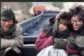
7 양양군 남애항_고래사냥(84) 낙산_강원도의 힘(98)