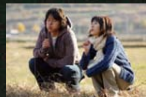
16 신돌 가을로(06) 백만장자의 첫사랑(06)