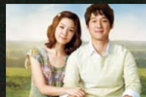
19 삼척시 교동_서서 자는 나무(09) 맹방해변_봄날은 간다(01) 신리 너와마을_서클(03) 신흥사_봄날은 간다(01) 죽서루_외출(05) 호산해수욕장_단적비연수(00)