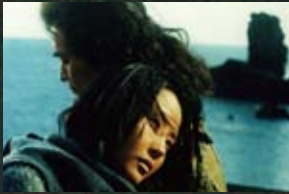
1 양구군 단적비연수(00)