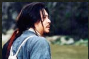
20 영월군 동강_취화선(02)