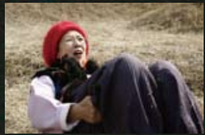
13 정선군 구절리역_S 다이어리(04) 굴암리_마지막 늑대(04) 동강_마지막 늑대(04) 동면 물운대_권순분여사 납치사건(07) 민동산_동승(02) 새비재_엽기적인 그녀(01) 아우라지_봄날은 간다(01) 아우라지역_가을로(06) 정선역_마지막 늑대(04) 정선터미널_봄날은 간다(01) 증산역_가을로(06)