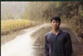
5 소양댐 생활의 발견(02)