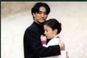
3 인제군 필레계곡_태백산맥(94)