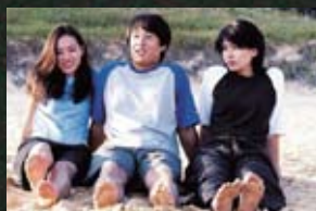
10 대관령 연애소설(02) 화성으로 간 사나이(03) 바람의 전설(04) 태극기 휘날리며(04)