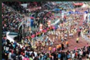
6 춘천시 강원대_소소소(02) 경강역_편지(97) 경춘선_앵무새 몸으로 울었다(81) 구곡폭포_앵무새 몸으로 울었다(81) 명동_챔피언(02) 소양로_소소소(02) 의암역_앵무새 몸으로 울었다(81) 의왕댐_차우(09) 종합운동장_말아톤(05) 중도관광지_와니와 준하(01) 청평사_생활의 발견(02) 춘천시_생활의 발견(02) 바람의 파티어(04)