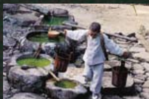
9 오대산국립공원 산책(00) 동승(02)