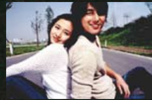
14 원주시 구룡사_내 머리 속의 지우개(04)