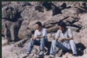
4 설악산국립공원 강원도의 힘(98)